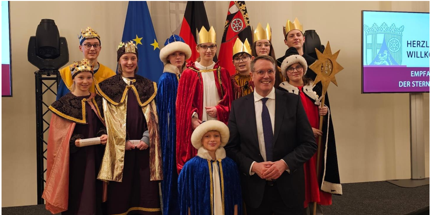
Gruppe der Pfarrei Daun Heilig Geist und Ministerpräsident Schweitzer

Sternsinger*innen der Pfarrei Daun Heilig Geist beim Empfang der Sternsinger bei Ministerpräsident Alexander Schweitzer in Mainz