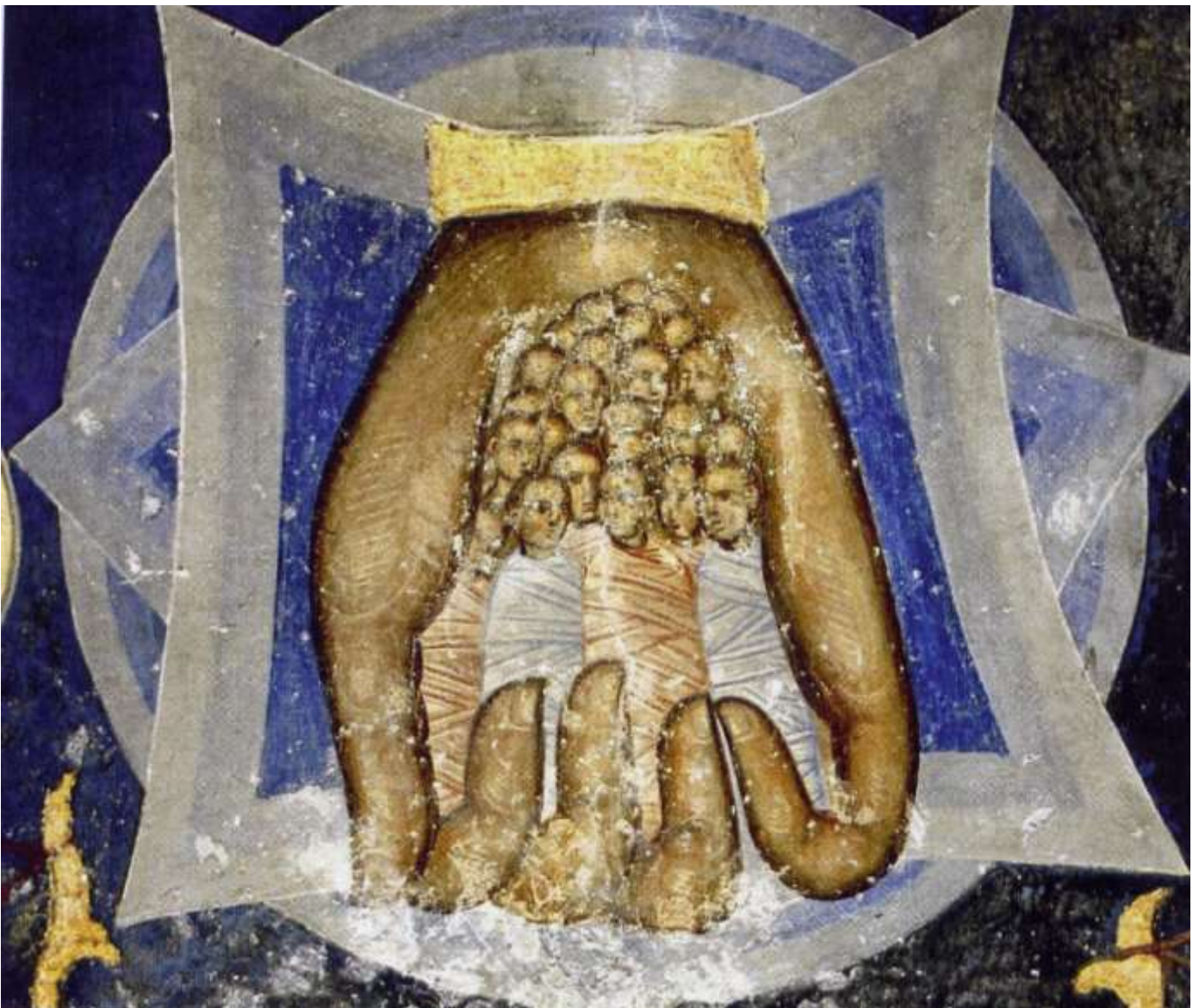
Resava, Dreifaltigkeitskirche, Westwand. Die Menschheit in der Hand Gottes (Ausschnitt) Fresko, um 1410/18; Foto: fotoload/Demid

Nr. 43/44/45/46/47 vom 23.10. bis 27.11.2022